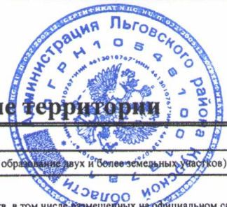
Схема границ сервитута на кадастровом плане территории

Основной номер земельного участка 46:13:020102:90/чзу1